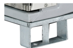
BASE DE PALETA (SOPORTE)