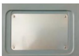
PLACA DE ETIQUETAS