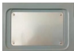
PLACA DE ETIQUETAS